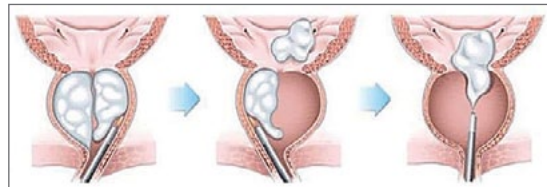
Abb. 1: Lösen der vergrößerten Innendrüse aus der Prostatakapsel mit dem Holmiumlaser und Absaugen aus der Blase.

Um zu erkennen, ob Sie von einer Entfernung des wuchernden Prostatagewebes Vorteile haben und ob es sich um gutartige oder etwa bösartige Veränderungen handelt, benötigen Sie eine Untersuchung beim Urologen/-in.