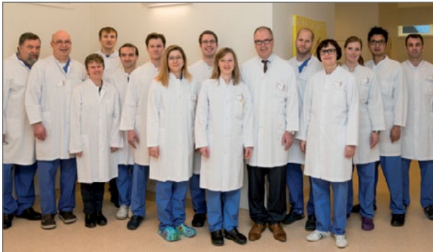
Das Ärzte-Team der urologischen Klinik