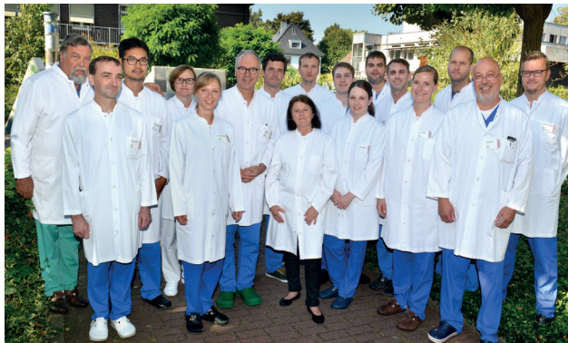
Das Ärzte-Team der urologischen Klinik